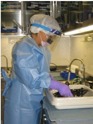
Nhân viên bệnh viện bị phơi nhiễm với các chất khử trùng độc hại

Bệnh suyễn liên quan tới việc làm (Work-related asthma, WRA) là một căn bệnh suyễn bị gây ra hay trở nặng hơn bởi cái gì đó tại chỗ làm. Các cuộc nghiên cứu chỉ ra rằng giữa khoảng 15-30% cơn suyễn của người lớn bị gây ra bởi các điều kiện hay các loại hóa chất tại chỗ làm. Có hơn 320 vật chất được biết gây ra bệnh suyễn mới ở những người không bị suyễn trước đây. Một vài ví dụ gồm có bột, một số hóa chất chùi rửa, một số loại khói hàn xì, cao su, vảy da động vật, các loại keo, chlorine, isocyanates, phóc-môn, mặt cửa, một số thuốc khử trùng, và các loại dầu nhớt làm giảm nhiệt độ và ma sát kim loại.