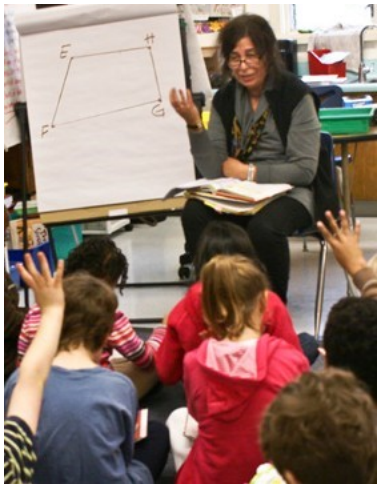
Giáo viên bị phơi nhiễm với nhiều chất mà có thể gây ra hay kích hoạt cơn suyễn, kể cả các sản phẩm lau chùi

Hỏi bác sĩ quý vị và cho người đốc công của quý vị biết nếu quý vị nghĩ rằng vấn đề khó thở của quý vị có thể liên quan tới việc làm của quý vị. Người đốc công của quý vị có thể gửi quý vị đi gặp bác sĩ chuyên môn tập trung vào các vấn đề sức khỏe liên quan tới việc làm. Viết xuống tên chính xác của các loại hóa chất hay sản phẩm mà quý vị làm việc với hoặc được sử dụng tại chỗ làm của quý vị.