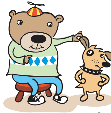
Timothy busca detrás de las orejas de Bullseye a ver si encuentra alguna garrapata.