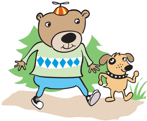
Timothy Tickfinder y su perro Bullseye

Las garrapatas se encuentran en los bosques o en áreas con mucha hierba, especialmente al lado de los caminos.