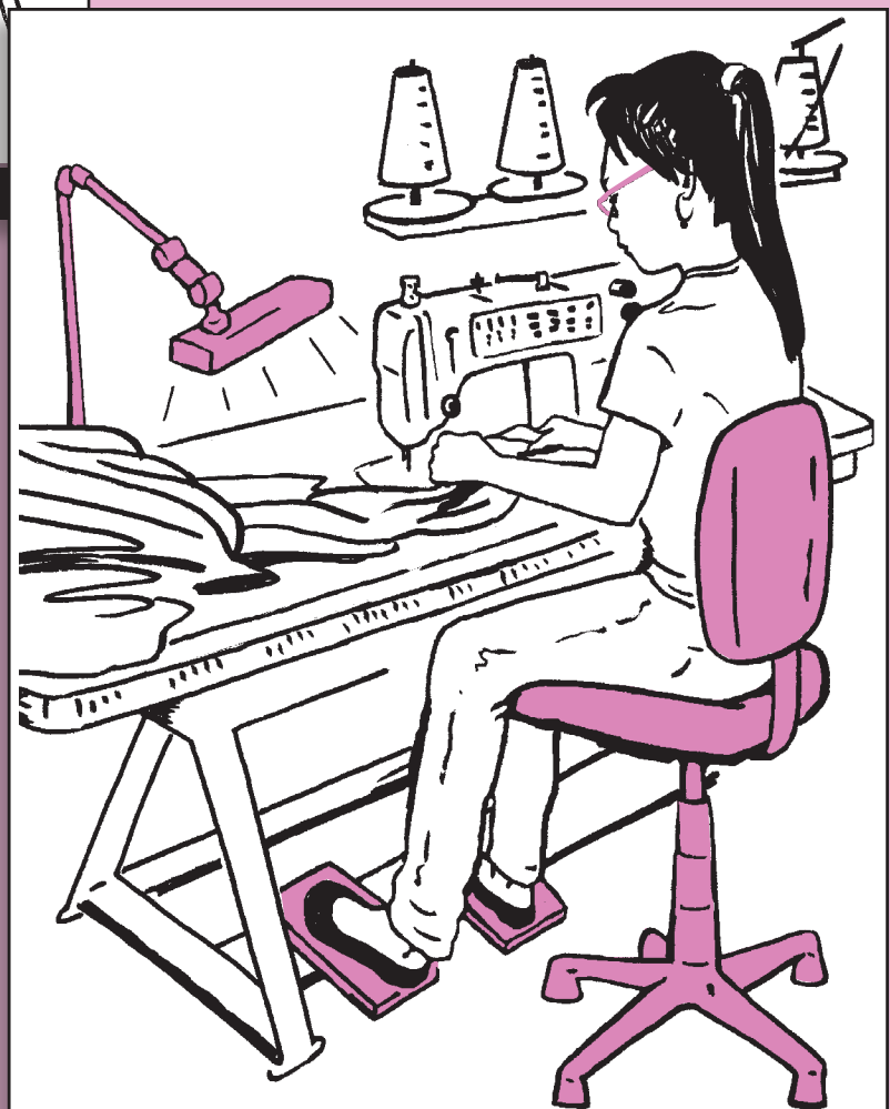
Estos cambios pueden prevenir molestias

Hay muchas maneras de hacer que su área de trabajo sea más cómoda.